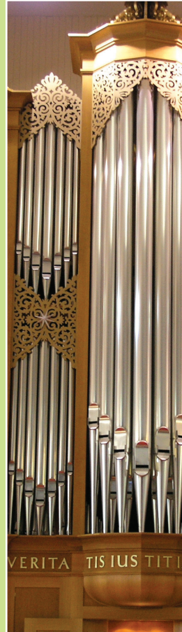
Adams Chapel Organ